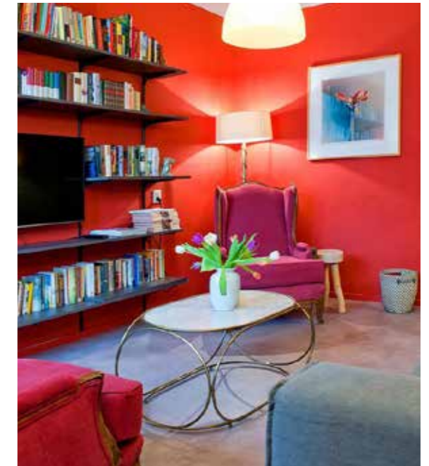
Ingericht naar uw eigen smaak