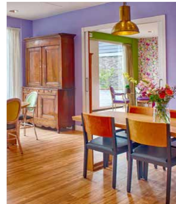
In het hart een prettige ruimte: de Meander